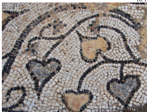
Po: T. Lasconi, 365 + 1 dan s Tebo

Bil je učenec sv. Cirila in Metoda. Rodil se je med letoma 830 in 840,